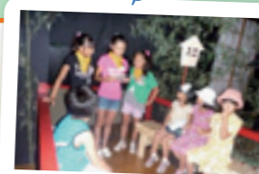
夏休み「伝説★妖怪屋敷」のお手伝い